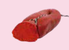
ソブラサーダ (チョリソ味のバテの腸詰め) Sobrasada