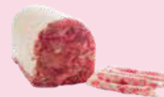
カベサ・デ・ハバリ (天然イノシシと豚耳のテリーヌ) Cabeza de jabali