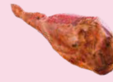
ハモンセラノ Serrano ham