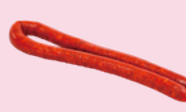
チストーラ (バスク地方のソーセージ) Chistorra