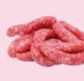
サルチチャ (豚肉のソーセージ) Pork sausage