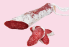
サルチチョン (サラミ) Salchichón